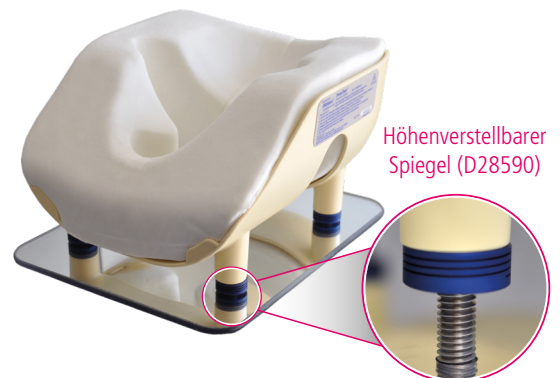
Höhenverstellbarer Spiegel (D28590)