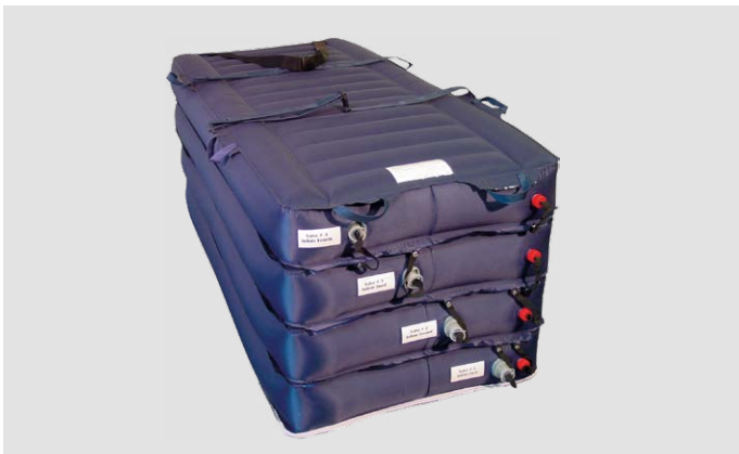
HoverJack® im befüllten Zustand