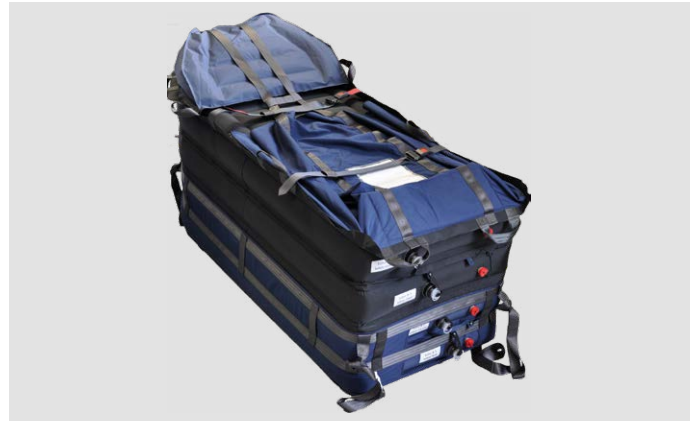
Evacuation HoverJack® mit vier gefüllten Luftkammern