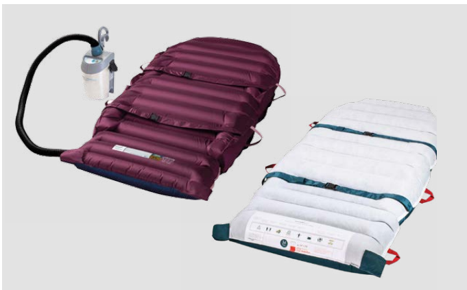
HoverMatt® Mehrweg- und Einwegprodukt