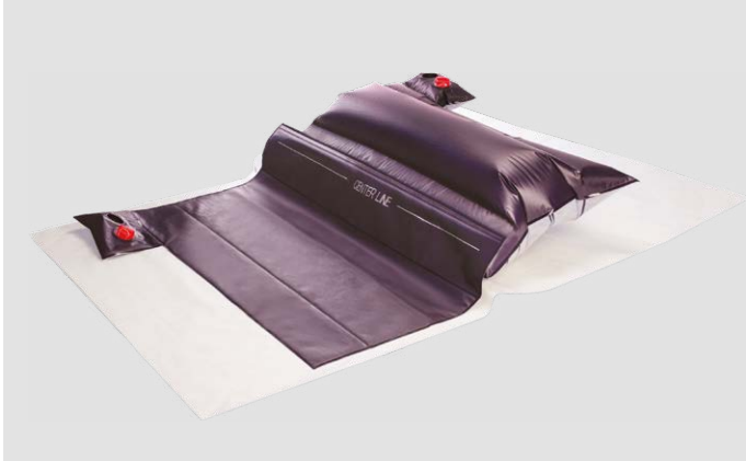
Q2Roller® mit 2-Kammer-System

Die Pflege und Versorgung adipöser oder schmerzempfindlicher Patienten ist herausfordernd. TapMed bietet Lösungen für verschiedene Bereiche.