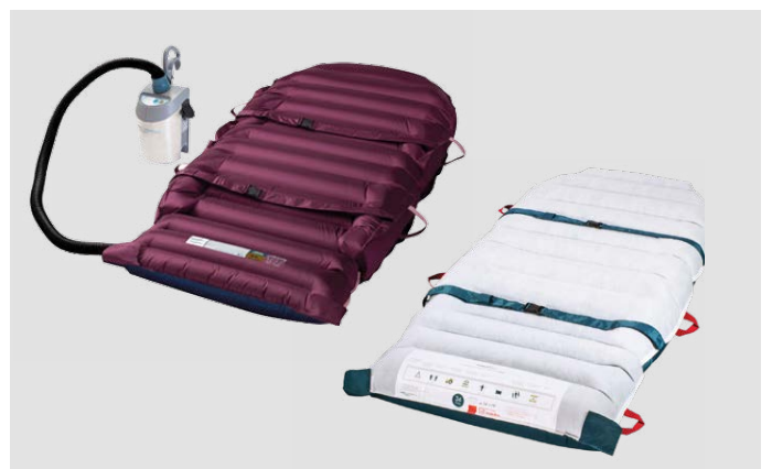
HoverMatt® Mehrweg- und Einwegprodukt